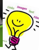
讀、寫、聽、講是語文課的重要元素

最後，跟大家分享近日閱讀所得。近日從有關心理學的書籍上學到兩個詞彙：畢馬龍效應 (Pygmalion Effect) 和格蘭效應 (Golem Effect)。前者與「自我應驗預言」( Self-fulfilling Prophecy ) 相似：當人感到獲信任或被賦予高期望時，通常都能回應期望而努力，做出比實際能力更好的表現；後者則相反，當人不抱任何期待，能力就無法發揮，表現低落。我相信將這些說法應用在教學上，效果是相同的，下圖是很有趣的解說和提醒。願意我們都能做個給予鼓勵的人，願我們的孩子都能充滿自信、好好發揮。