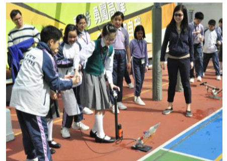
六年級學生：發射水火箭需要什麼工具呢？

同學感到開心的，還有家教會親子大旅行，當日約八百名家長、學生、老師、校友同往大棠渡假營，雖因天氣不太穩定，營地只能開放部份設施，但親子共行，享受與家人相處最可貴。我想起專欄作家陳惜姿女士的一篇文章〈理想的旅行〉，大意是說家人為高昂的旅遊消費到處格價，但一輪功夫後，發現孩子認為最難忘的旅行回憶，原來是一次郊遊中大伙兒在大屋裏玩捉迷藏的片段。她發現，孩子還小的時候，再精緻的民宿、再巍峨的山嶺，還不及和喜歡的人同在，只要能和玩伴一起，有一個寬闊的空間，去哪裏反而沒那麼重要。她說自己被孩子這個答案擊倒了！有一句話很真實：‘The Best Present is Presence!’(同在是最好的禮物)。真的，在這個忙碌、疏離的世代，沒有什麼比真心付出時間相伴更能表達愛意和關懷。見到很多家長與孩子把握機會好好聊天、沿途說說笑笑，更有很多家長花心思拍照參加「溫馨親子造型大賽」，我相信大家已給了孩子最好的了！