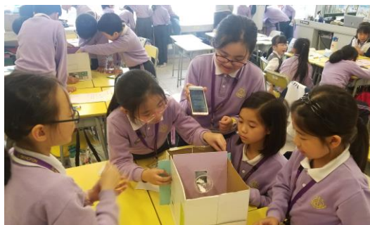
四年級學生：如何製作一個又舒適又高效能的口罩呢？