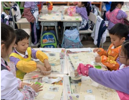
一年級學生：用哪一種物料做圍裙最防水呢？

三月份忙碌而充實，先有三天跨學科學習日，讓各級學生進行各樣「動手做」的趣味實驗及戶外參觀。我見到學生從不停優化作品的過程中，學會團隊協作及積極思考。例如，有同學向我介紹如何令分組設計的「耳罩」更貼耳、實用，也有同學向我解釋用何種物料來提升「口罩」的功能，當然，我也欣賞了部份「水火箭」的試射過程，再與同學交流應如何進一步改善。這種透過反覆提問、想像、計劃、評估及測試，並進行改善的過程，正是 STEM 所提倡的探索和思考精神呢！